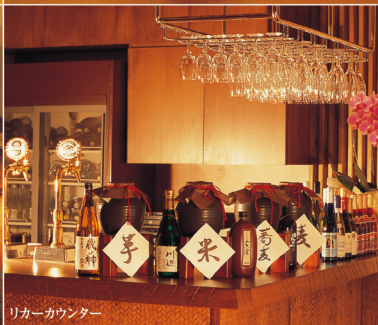
リカーカウンター