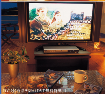
DVD付液晶テレビ(DVD無料貸出し)