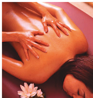
■オイルマッサージ

「長寿の科学」という意味をもつ、古代インドから伝わるリラクゼーション療法。体液のバランスと体のゆがみを整え、心身ともに健康に。美脚スペシャル、顔つぼ、フルボディーなど、メニューもいろいろ、気分に合わせて。