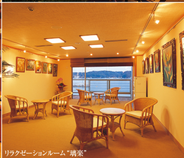
リラクゼーションルーム“璃葉”